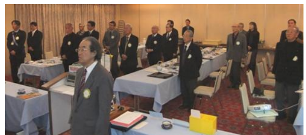
新年初例会＝国歌斉唱・ロータリーソング