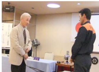
会長より卓話のお礼