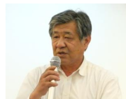
講師紹介の山口君