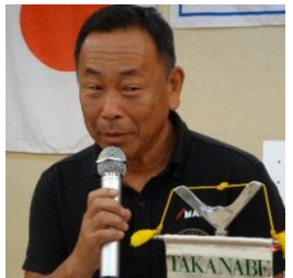
新店舗の案内 道北君