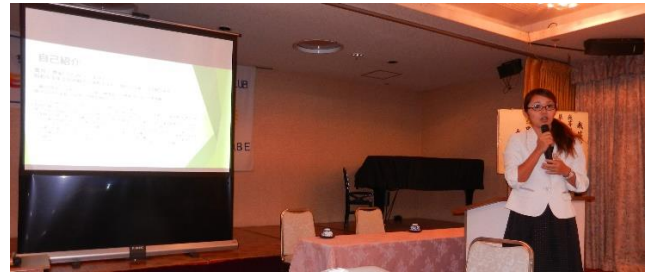
「子どもの貧困に向き合う」