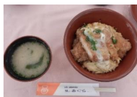
おぐら最後の例会食事