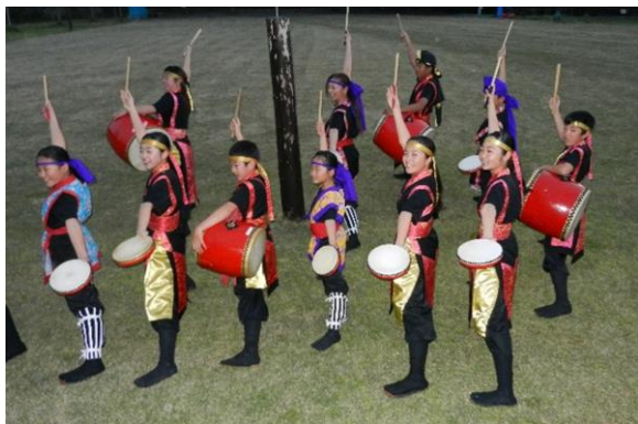
しんかんちやーの踊り & ハーブ牛の焼肉