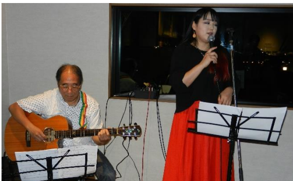
美しい歌声とギター演奏〜 ♪♪