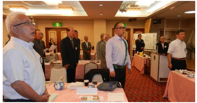
点鐘後のロータリーソング