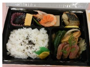
本日の食事 ママンマルシェ