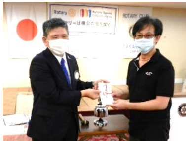
曾我部君退院おめでとう!