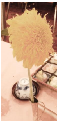
テーブルの花 ひまわり