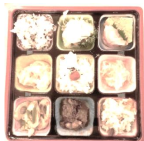
本日の食事 ぐらんま亭