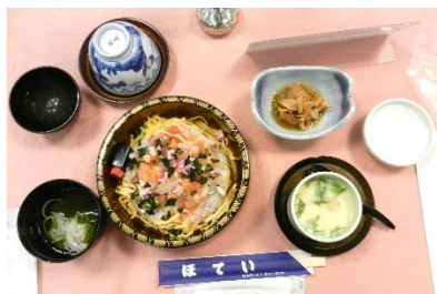
本日の食事 ほてい寿司