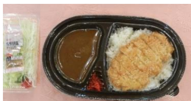
本日の食事 大使館