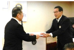
高鍋高校ラグビー部全国大会花園出場寄付金贈呈