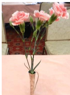
卓上の花 カーネーション