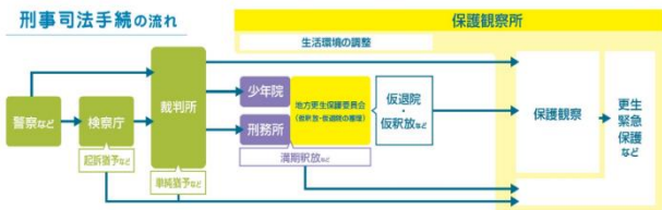
図: 刑事司法手続の流れ

(罪に問われた者) となります。サラちゃんの左はイタチ科のオコジョをモチーフにした更生保護女性会です。更生保護女性会は更女(こうじょ)と略されますので、それをもじっています。ホゴちゃん、の右側がアシカをイメージした協力雇用主です。最後列の青とオレンジのイルカはBBS(ビッグ・ブラザーズ&シスターズ)会です。これらのキャラクターは、罪に問われた者の自立・更生に伴走するネットワークとしてイメージされています。それではまず、人が罪に問われるとどのようになるかを、おさらいとして見ていきましょう。