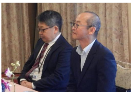
中村署長様 河野総務課長様